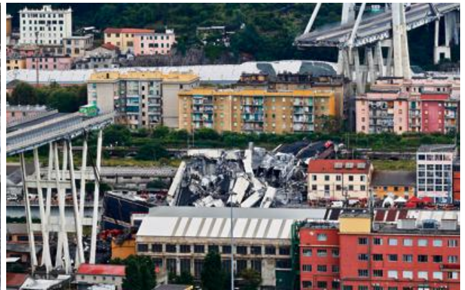
Les secours au travail sur le pont Morandi effondré, à Gênes, le 14 août.